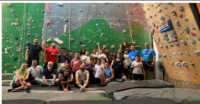
Participantes da vivência de escalada no Ginásio Mantiqueira Escalada de estudantes e professores da Escola Municipal Ernani Gianico.