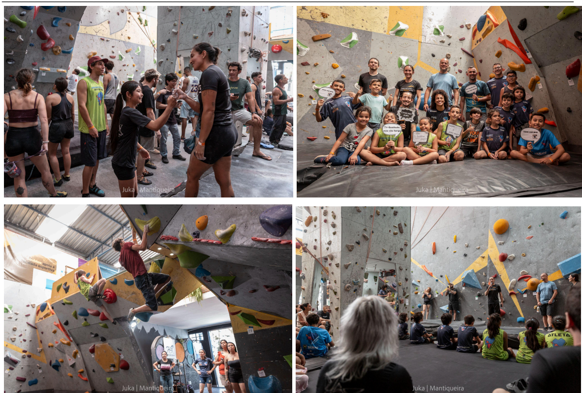
Registros do Festival Open de Boulder 2024 no ginásio Mantiqueira Escalada