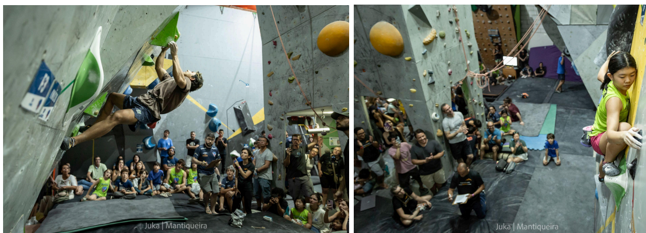
Registros do Campeonato Paulista de Boulder no ginásio Mantiqueira Escalada

O Instituto Para Escalada apoiou a organização do Campeonato Paulista de Boulder, realizado em maio/2024 no ginásio Mantiqueira Escalada, que contou com a participação de quase 100 atletas de todo o estado de São Paulo. Nossa equipe atuou na arbitragem e na organização do evento de forma voluntária.