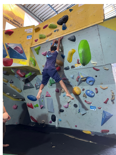
Crianças da Escola Municipal Ernani Gianico recebendo orientações de voluntários do Instituto Para Escalada e escalando na vivência no ginásio Mantiqueira Escalada.