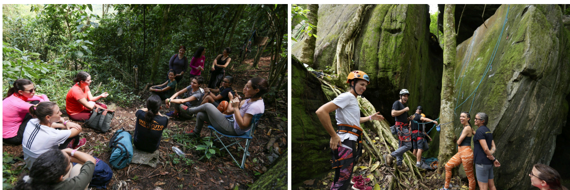
Oficina de Introdução à Escalada para mulheres que nunca haviam praticado escalada na rocha, durante o Encontro Mulheres na Natureza na Falésia Paraíso

Em celebração ao Dia Internacional da Mulher, o Instituto Para Escalada organizou o encontro Mulheres na Natureza , no Abrigo e Falésia Paraíso em Pindamonhangaba/SP, entre os dias 09 e 10 de março/2024. O evento contou com a participação de cerca de 70 pessoas, sendo 70% delas mulheres, muitas que nunca antes haviam escalado na natureza. No evento, além de práticas de escalada, pedal e yoga foram realizadas oficinas, palestras, bate papo e outras atividades visando contribuir para ampliar a participação feminina nas atividades na natureza.